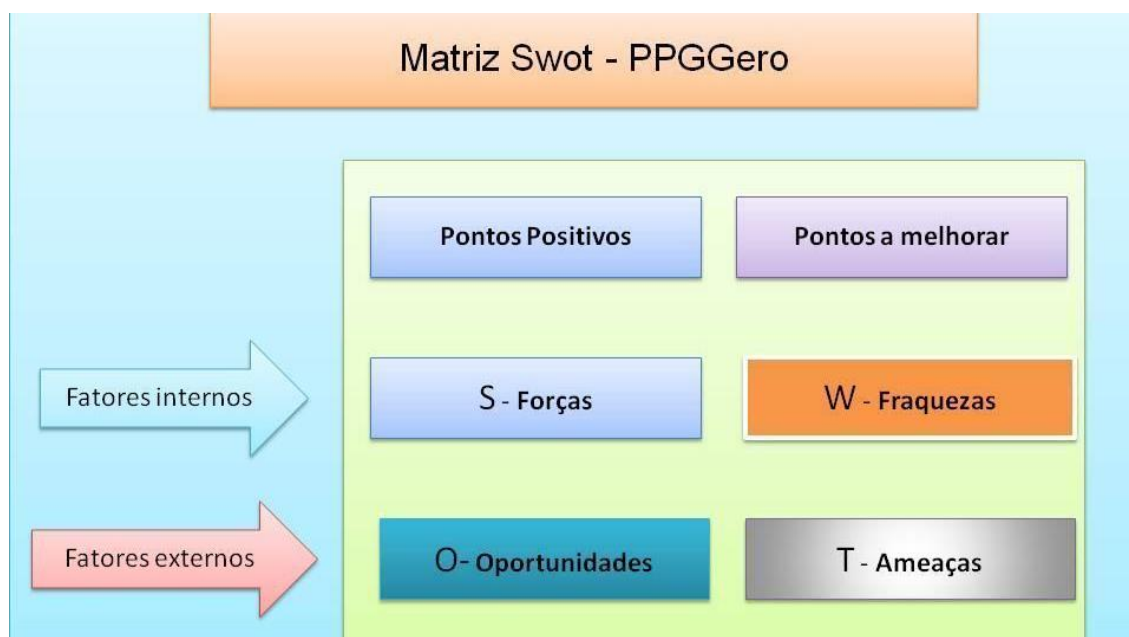
Figura 2: Diagrama representando o método SWOT.

A análise dos ambientes interno e externo foi realizada por meio da matriz SWOT (representada na figura abaixo), cujos conceitos estão descritos a seguir: